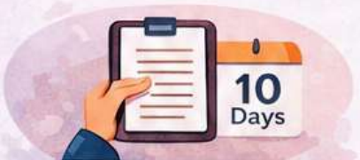
Submit written complaint within 10 days