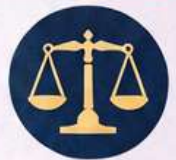
Protection & support