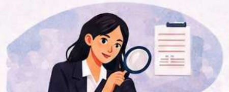
ICC completes inquiry within 90 days