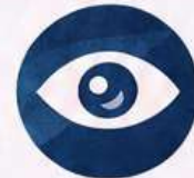
Confidentiality of inquiry