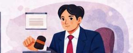
Action & resolution by employer