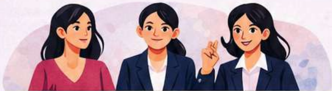
Female Employee | External Female Member